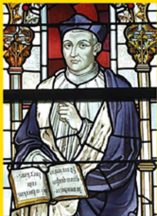
Thomas afgebeeld in het Rijksmuseum (detail).

aan de rand van de Schaersheide te Bredevoort komt ter sprake.