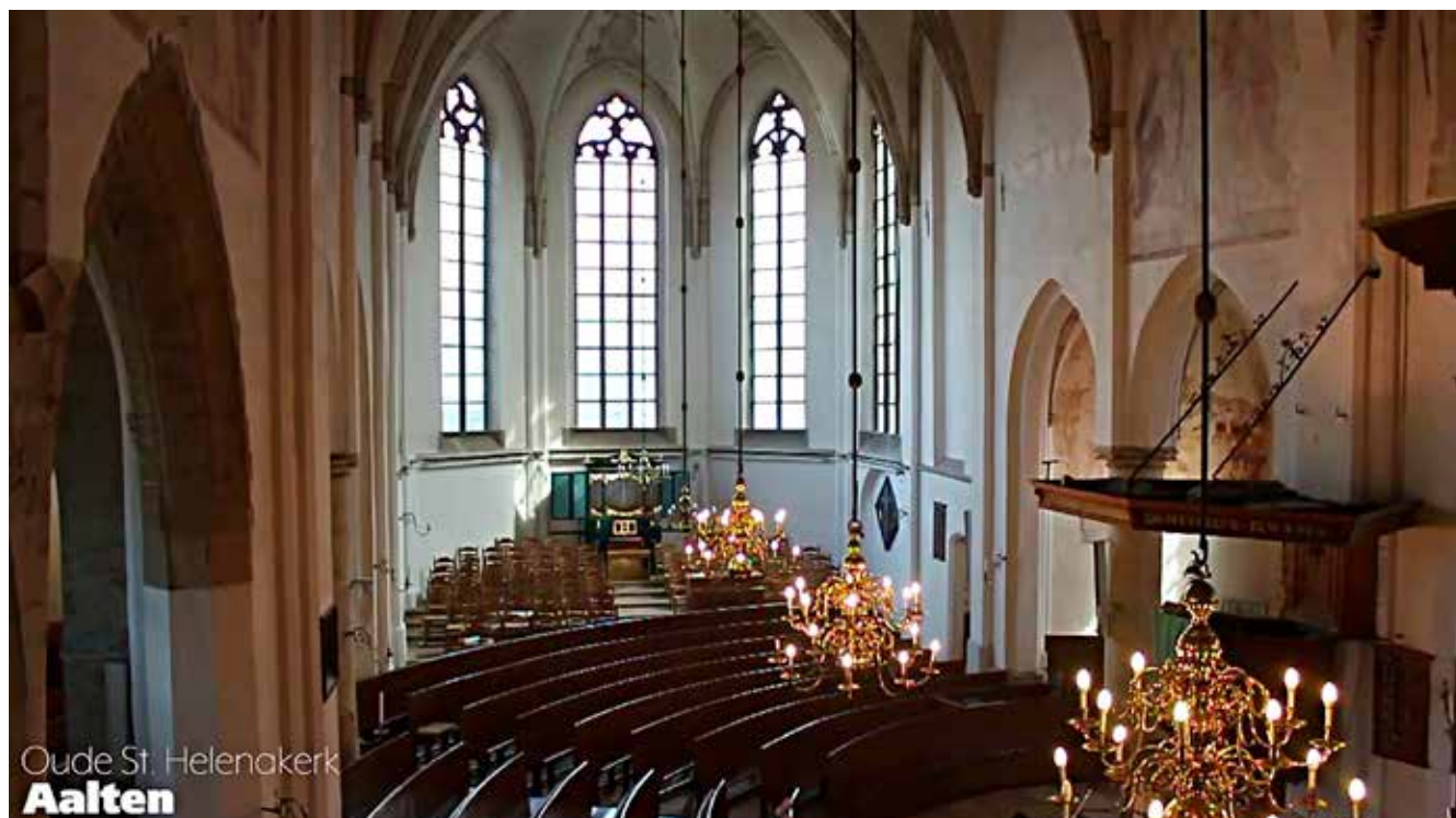
Oude St. Helenakerk Aalten

Wezenlijk voor het samen-gemeente-zijn is het omzien naar elkaar. Vanuit de verbondenheid van het geloof en in het licht van Gods liefde proberen we oprecht met elkaar mee te leven en aandacht te hebben voor elkaar. We noemen dit het onderlinge pastoraat (= herder zijn voor elkaar).