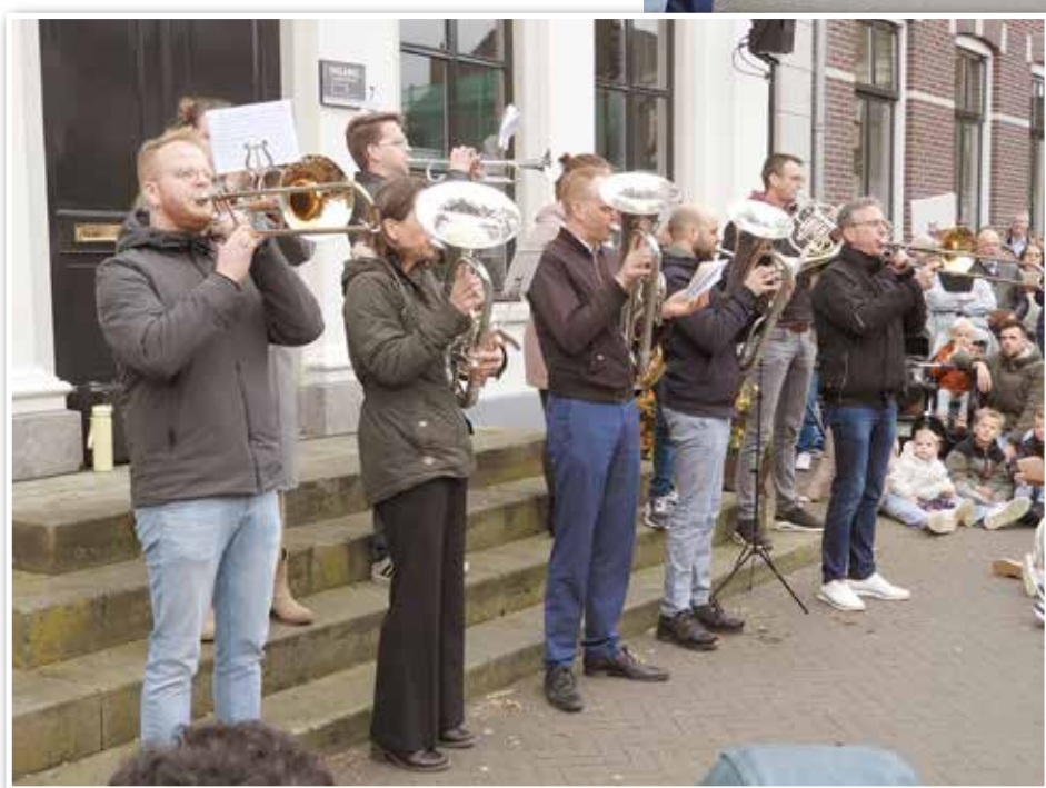
De jeugd heeft de toekomst