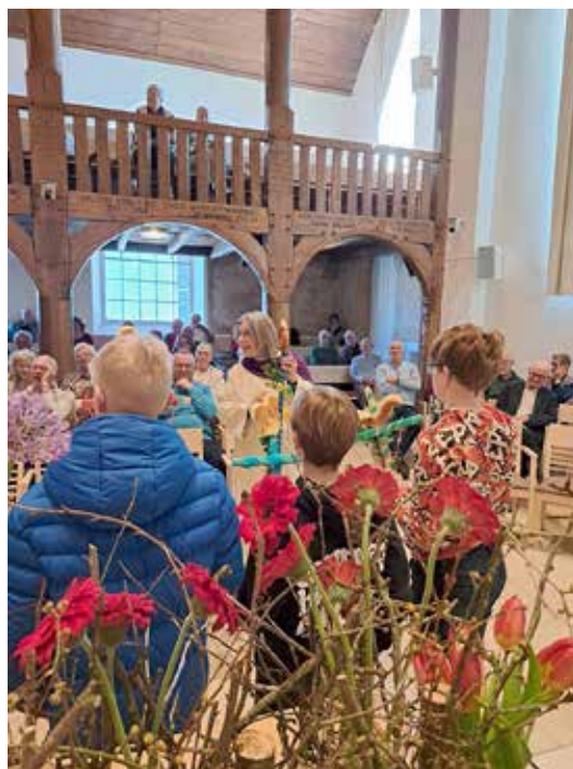
Palmpasen, foto Arjan Twigt, kijk ook op pagina 9

Collectes in de dienst en online . . . € 743,55 Giften Samen Eten . . . . . € 302,00 Giften ontmoetingsmiddagen . . . . € 40,00